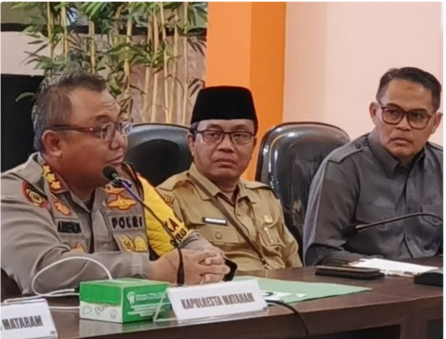
Kapolresta Mataram (Kiri) saat memimpin Konferensi pers akhir tahun, Selagi (31/12/2024)

MATARAM, NTB – Polresta Mataram mengakhiri tahun 2024 dengan menggelar Konferensi Pers Akhir Tahun, sebuah forum transparansi untuk memaparkan capaian dan inovasi yang telah dilakukan selama satu tahun. Kegiatan yang